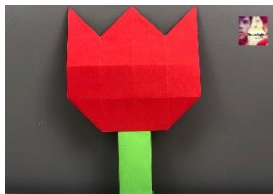
Instructievideo - Tulpe 16 vierkantjes

Om het moeilijker te maken, kun je met twee dobbelstenen gaan rollen.