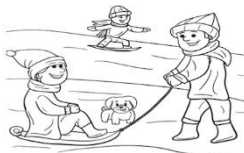
Winter werkboekje Groep 1

Mocht dit nog te moeilijk zijn is het ook leuk om het lekker wel met de kleuren te spelen!